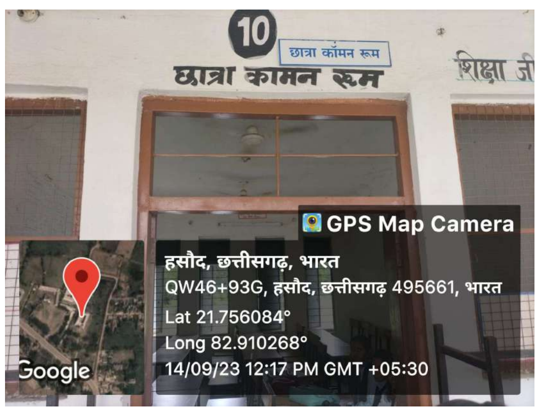
Girls Common Room